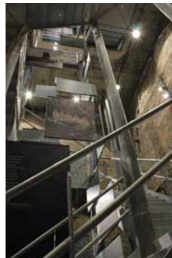
De vlot toegankelijke trap brengt je zo naar de eerste verdieping.