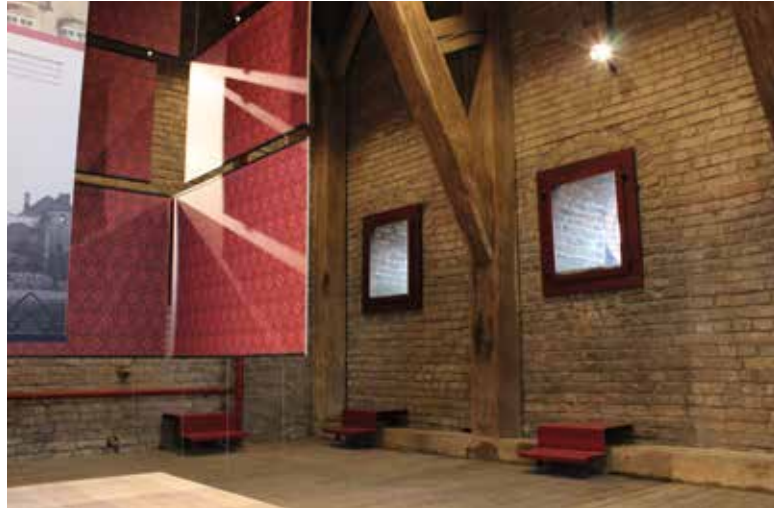
Op de eerste verdieping kan je dankzij de opstapjes al een blik werpen op de omgeving.