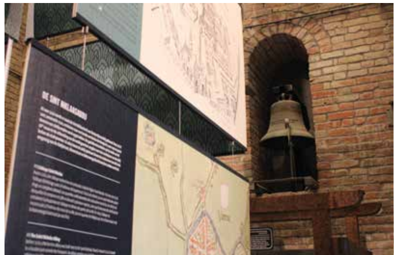
Ontdek de geschiedenis via duidelijke infoborden.