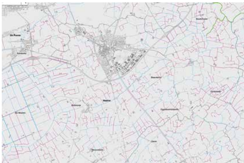
Voorbeeld van de kaart met gerangschikte onbevaarbare waterlopen en publieke grachten

Voor de gerangschikte onbevaarbare waterlopen toont de digitale atlas de aslijn van de waterloop en informatie over de bodem- en kruinbreedte en de diepte van de bedding. Die informatie is op bepaalde locaties langs de waterloop toegevoegd als atlaspunt: aan de bron, aan de monding en minstens op elke 500 meter daartussen. Waar geen recente opmetingsgegevens beschikbaar zijn, is de informatie uit de oude atlassen overgenomen. De informatie is beschikbaar onder de vorm van dwarsprofielen of via de gemeten waarden voor bodem- en kruinbreedte en de diepte van de bedding. Voor de publieke grachten bevat de digitale atlas de aslijn en informatie over de breedte van de