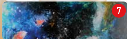
† ZONNEPALET Deel 2

Mysterieuze verschijningen doen ons wegdromen in een wereld van kleuren, vormen en schaduwen. Enkel door het licht kunnen we dit spanningsveld aanschouwen.