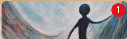
† ZONNEPALET Deel 1

Visit Veurne wil tijdens de donkerste dagen van het jaar gezelligheid, licht en warmte brengen. Aan de hand van een kunstwandeling doorheen het stadscentrum maak je kennis met verschillende kunstenaars die creatief aan de slag zijn gegaan met licht. Licht in de meest uiteenlopende betekenis van het woord. Ze kijken er dan ook naar uit om je te verwonderen met hun kunst. Geniet samen met je bubbel van de wandeling en laat de werken een lichtpuntje zijn in deze kerstperiode.