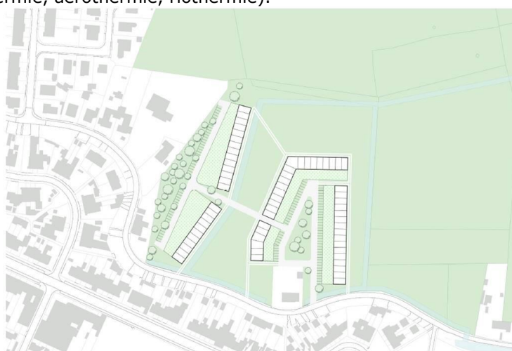
Afbeelding: Visiedocument Proostdijk

Studiebureau Omgeving maakte een plan op voor de ontwikkeling van 65 grondgebonden woonéenheden. Nieuw overleg met de private ontwikkelaar in dit project is opgestart. De mogelijkheden voor verwarmingsvoorzieningen voor deze verkaveling worden momenteel onderzocht (geothermie, aërothermie, riothermie).