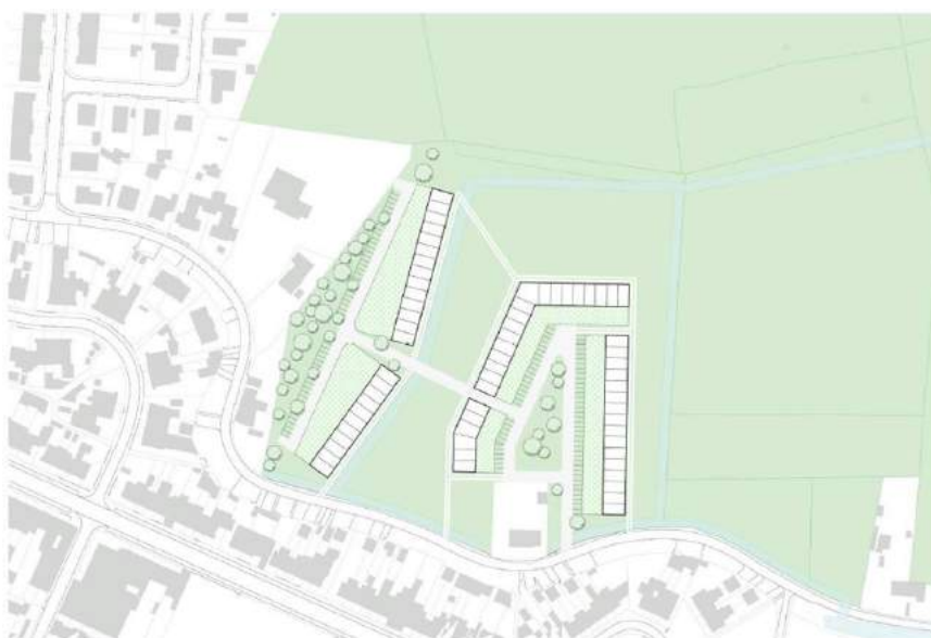
Afbeelding: Visiedocument Proostdijk

Studiebureau Omgeving maakte een plan op voor de ontwikkeling van 65 grondgebonden woonéenheden. Overleg met de private ontwikkelaar in dit project staat op de planning.